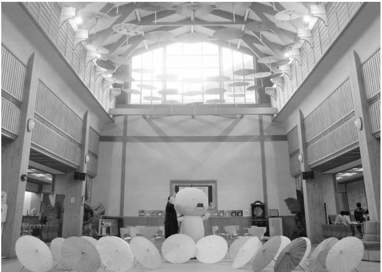
SDGsにちなんアンブレラスカイ