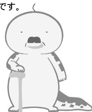
オッサンショウオ 日南町 公式キャラクター