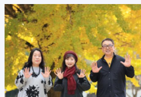
日南町ボーカルユニット 歌実(うたたね)