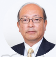
日南町 町長 中村 英明