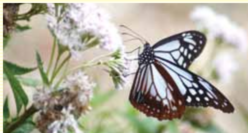
アサギマダラとフジバカマ 2016年7月28日撮影 (船通山)

“森の貴婦人”と呼ばれるアサギマダラが船通山頂上付近で7月～8月の間だけ見ることができのをご存じですか。