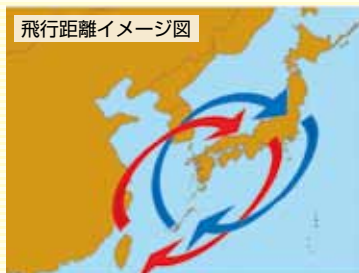
飛行距離イメージ図

また、雄が雌を誘うために欠かせないフェロモンの材料となる特定の植物(スナビキソウ・フジバカマ・ヨツバヒヨド