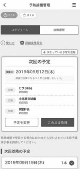
予防接種管理画面