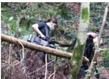
重いカメラをもって山の中にも入ります

日南町霞出身の20歳。日野高校を卒業後、(株)アシスト日南へ入社。現在2年目で、撮影や編集・企画を担当している。