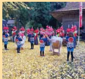
優秀賞 @kei_tomatoya 多里・かしらうち