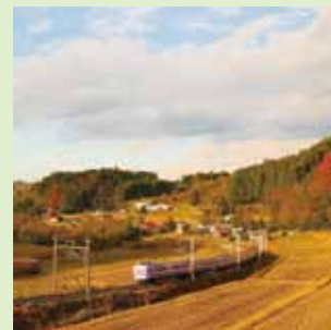
@sc430uzz40ic760 石見・特急やくも