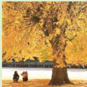
@yuuto_1610_773 日野上の大イチョウ