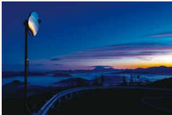
最優秀賞 @sukiyakiakisuki 桜子峠

Instagramを利用した日南町の魅力発信を目的として、昨年10月20日~11月30日に「ハッシュタグキャンペーン」を行いました。54名のみなさんから、総数124点の作品をご応募いただきました。みなさんご応募ありがとうございました。今回は、厳正な審査の結果入賞された10名の方の作品をご紹介します!