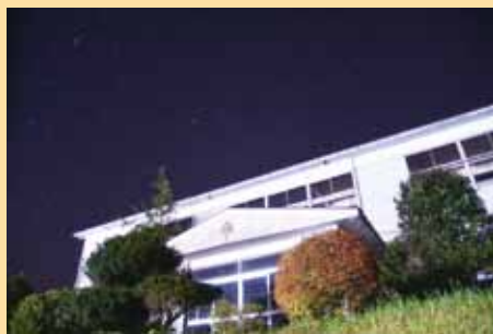
優秀賞 @hang_chan9112 旧福栄小学校