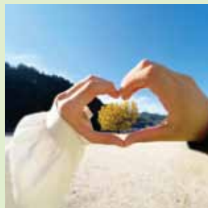
@nichi_nan7 日野上の大イチョウ