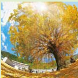
@folkboys 日野上の大イチョウ