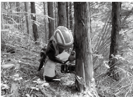
林業アカデミー伐木の授業