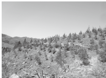
町有林への植樹活動