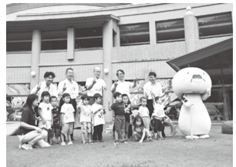
遊具を寄贈した企業と記念撮影