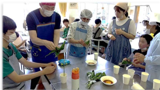
みんなで和気あいあい、楽しそう。