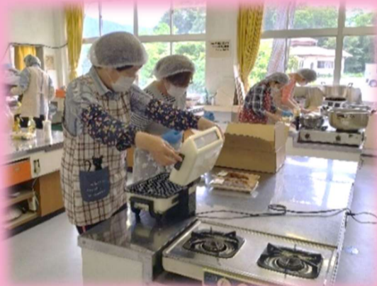
6月4日 弁当作りの様子です。山上地域振興センター第2会議室(調理室)で、4班のローテーションで作っています。食中毒の発生しやすい時期(7月~9月)は夕やけ弁当はお休みです。

「夕やけ弁当スタッフとして参加させてもらっています。コロナで長い間休んでいましたが、再開となりました。正直どうしようかなあという気持ちでしたが、弁当を待っていて下さる人がおられる事を思うと、気持ちを変えて頑張って参加しようと思直しました。自分の健康管理をして、美味しい弁当を提供出来るよう、スタッフ一同で献立を考えて、季節の料理を作りたいと思っています。月1回の弁当ですが、楽しみに待っていてください。」