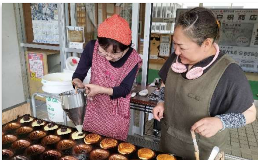
チョコやチーズやラムネあんなど、小豆あん以外の栗饅頭も作りました。