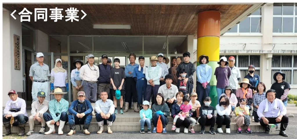
センター周辺の環境整備作業 作業前の集合写真です。

6月18日 朝8時30分から山上地域振興センター周辺の環境整備作業が行われました。あわせて、大草山登山道や忠魂碑周辺の草刈りも行われました。当日は天気も良く、暑い中、皆様お疲れ様でした。※現場へ直行された方数人は写っていません。