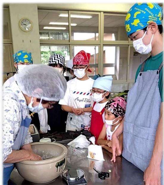
園児、小学生、中学生、大人、みんな一緒に体験しました。

最近では、ちまき作りをする人が少なくなりました。また、栗饅頭は、日野郡内に販売する方がおらず、縁日では米子の露天商が出店しています。