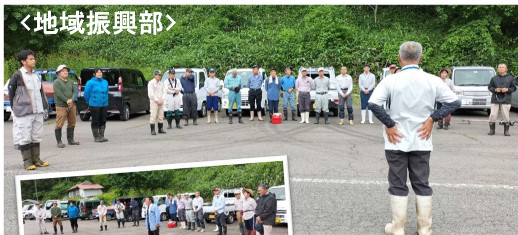
ホテル鑑賞地の草刈り 皆さんおはようございます!

6月5日 朝8時30分から福万来地区のホテル観賞地の草刈り作業が行われました。ホテル観賞地とそこに至るまでの道の草刈りをしました。暑い中、ありがとうございました!