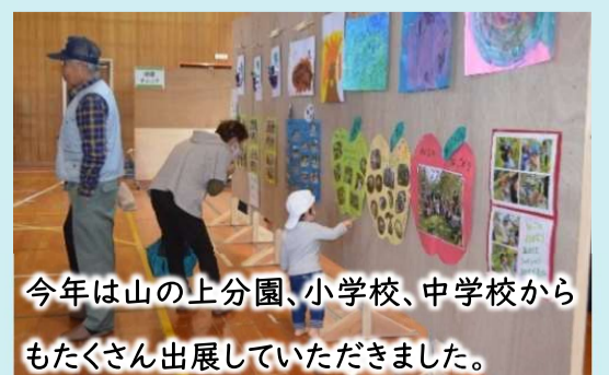
今年は山の上分園、小学校、中学校からもたくさん出展していただきました。

「香茸入り大山おこわ」「猪汁」「栗まんじゅう」「アメダス茶屋さんのスイーツ販売」「さくらんぼさんのパン販売」などの食べ物を販売し、4年ぶりの飲食販売を伴う文化祭になりました。食品や、苗花販売などの豊富な出店で、ご来場くださった皆さんも楽しんでいただけたことと思います。毎年企画から準備・運営・片付けと、多くの皆さんの協力のもとに成り立っているのだと、あらためて感じられた1日でした。