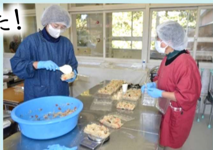
調理室は朝から大忙し。 栗まんじゅうと香茸入り大山おこわ作り。