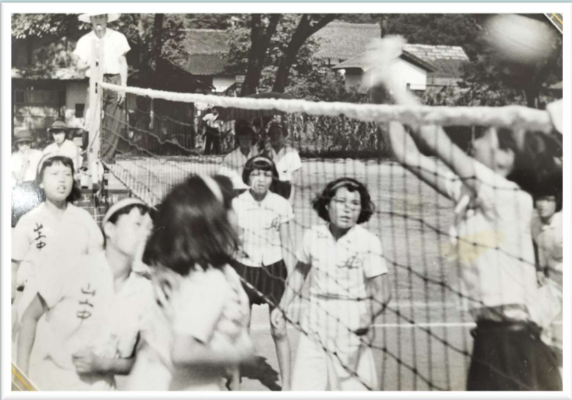
山上中学校女子バレー部(左)

山上中学校応援歌二 真澄の空に そよぐ窓 希望に燃ゆる 肩上げて あふれる生命 澆刺と 君等の腕 その脚で おお 山上中学 栄冠を呼べ みどりの風も 爽やかに 血汐も踊る 胸を張り 力ぞ技ぞ 悔ゆるなく 鍛えた身体 意気見せよ おお 山上中学 栄冠を呼べ かがやく光 雲の果て 校旗のもとに ほほえみて 勝利を目指し 咲く花に 誉の記録 打樹てよ おお 山上中学 栄冠を呼べ