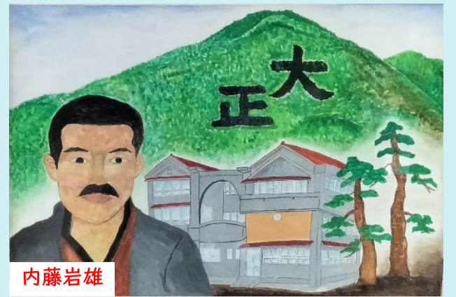
錦着て 帰る故郷の 若葉かな