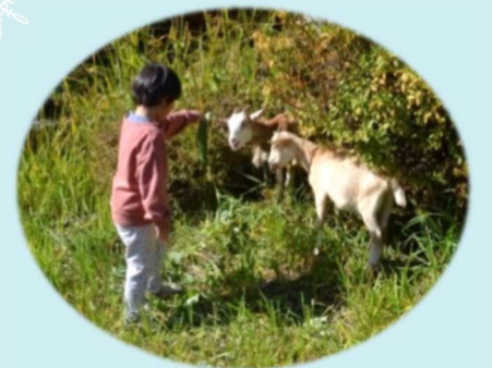
ヤギ3頭がいる『ふれあい動物園』 子供たちに大好評でした。