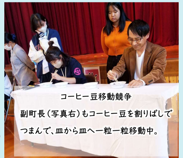
コーヒー豆移動競争 副町長（写真右）もコーヒー豆を割りばしでつまんで、皿から皿へ一粒一粒移動中。