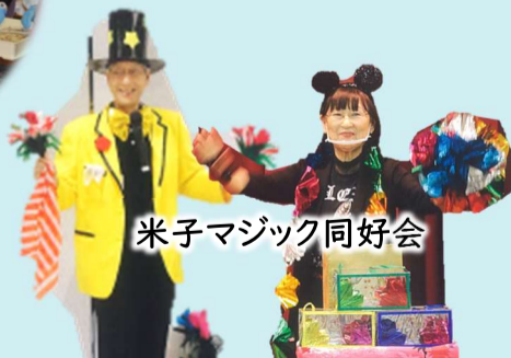
米子マジック同好会