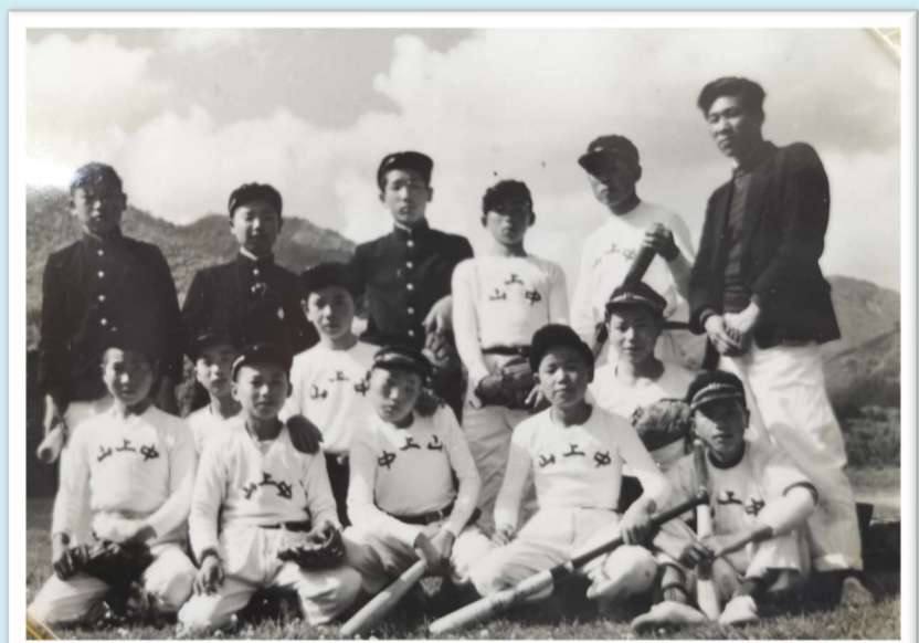
山上中学校野球部