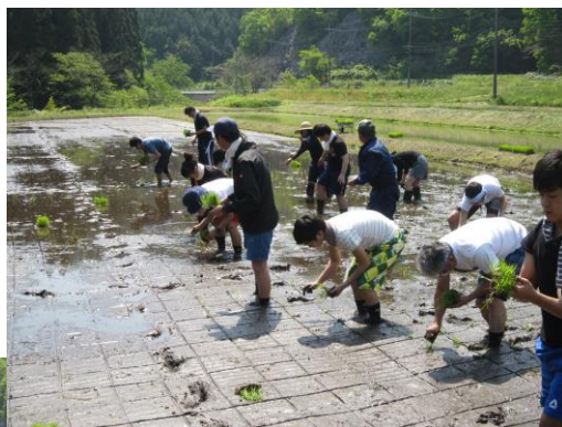
ていねいに植えています