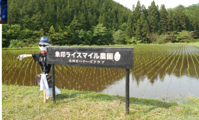
収穫まで案山子を守ってくれます