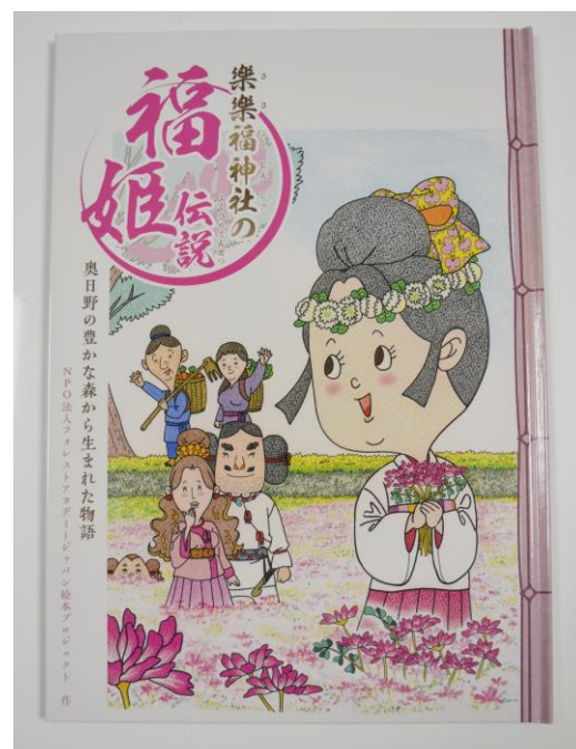
完成した「福姫伝説」の絵本

たたら製鉄と深いかわりを持つといわれる「福姫伝説」。大宮に伝わる物語を、これからも語り継いでいきたいですね。この絵本は、地域振興センターに置いてありますので、ぜひ一度ご覧になってください。