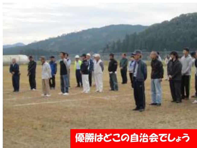
優勝はどここの自治会でしょう

10月16日(日)、毎年恒例の「大宮運動会」& 「収穫祭」が開催されました。運動会では玉入れやグラウンドゴルフ、そして名物となっているスリッパ飛ばしなど、笑顔があふれる楽しい運動会になりました。運動会の後は、産業部主催の「収穫祭」。今年も無事に収穫できたことをねぎらい、みんなで秋の美味しいものをたくさん食べました。来年も、この行事を続けていきたいと思ひます。