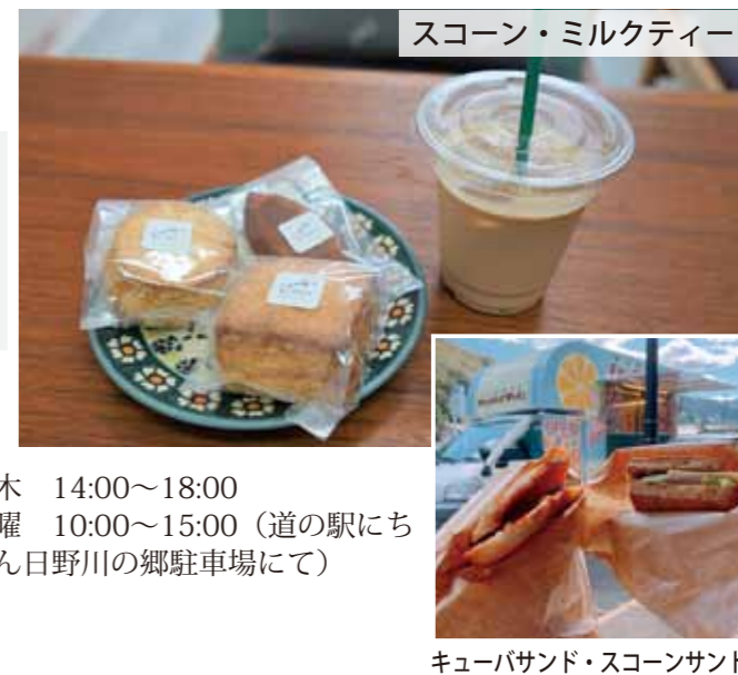
スコーン・ミルクティー

日南町生山148-2 時間：店舗 火・水・木 14:00～18:00 キッチンカー 日曜 10:00～15:00 (道の駅にちなみ日野川の郷駐車場にて)