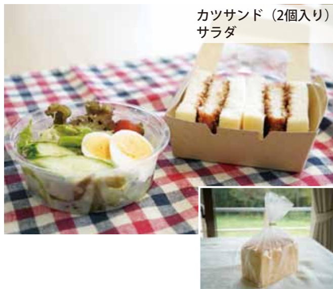
カツサンド (2個入り) サラダ