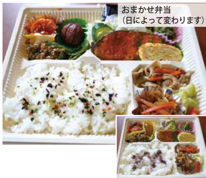
おまかせ弁当 (日によって変わります)