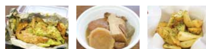
せせりの鉄板焼き