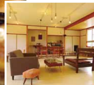
2階イートインスペース