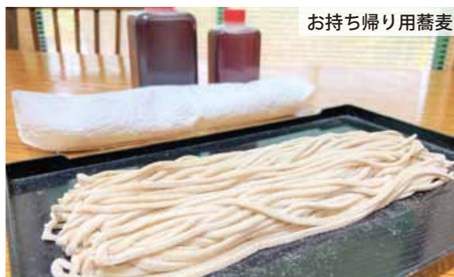
お持ち帰り用蕎麦