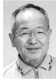
福 万 来 若 月 一 夫