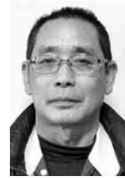
福 寿 美 山 影 明 也