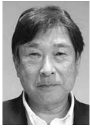
福 塚 足 羽 覚