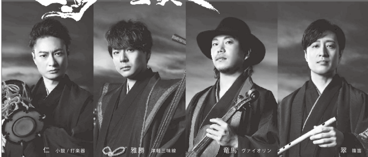
仁 小鼓 / 打楽器

2023年 8月6日 (日) 開場14:30 開演15:00 日南町総合文化センター さつきホール