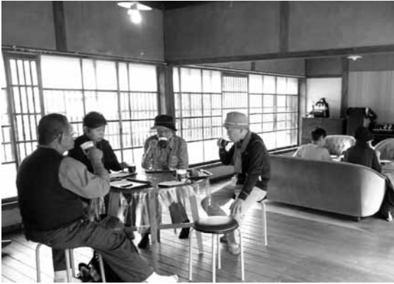
昨年度、むら協の企画として初めて旧木下家でイベントを開催しました。今後もカフェやイベントを開催するため、必要な修繕などを行います。

そのほかにも、旧木下家でのイベント開催に向けた施設の修繕や整備、御墓山の山道整備やPRのためのイベント開催なども計画しています。