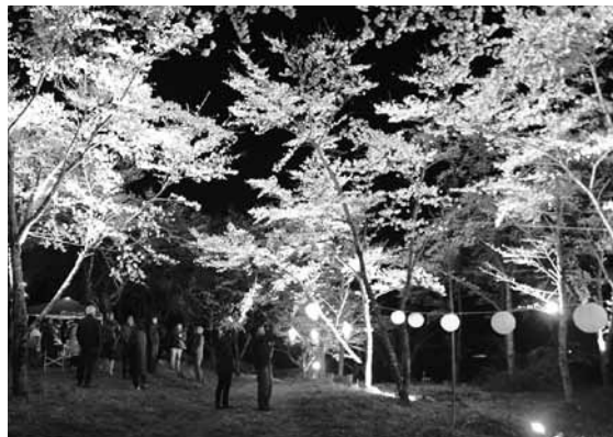
年3回の草刈り・伐採と施肥を行い毎年美しい桜の花が咲くようになりました。ライトアップの日には、県外の方も立ち寄ってくださいます。