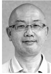
阿 毘 縁 生 田 享 也