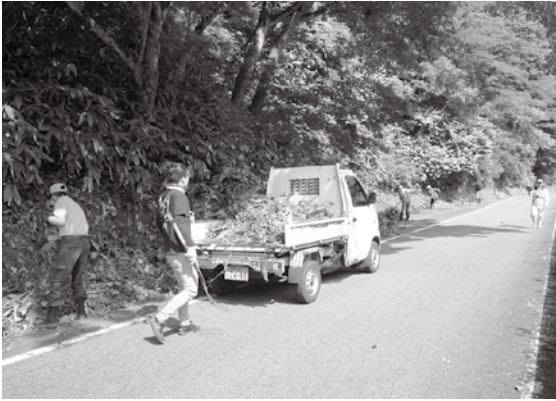
「福万来ホテル乃国」おもてなし前には、毎年地域総出で観賞スポットの整備作業を行い、来場者を迎える準備を整えています。

また、地域の代表的なイベントとしてすっかり定着した「福万来ホテル乃国」のおもてなしが、今年も6月30日から7月12日まで開催されます。新型コロナウイルスを取り巻く状況も変化したことにより、過去最大の来客数を見込んでおり、地域一丸となって事前の準備に取り組んでいます。来場者のみなさんと一緒になってこのイベントを成功させ、地域の価値を高められるよう皆で奮闘しています。