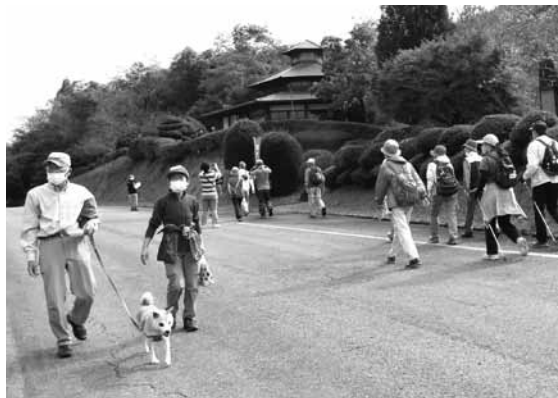
ウォーキング大会の広報のため、チラシ配布や設置だけでなく、過去の参加者へはDMを送るなどして、広くPRを行います。