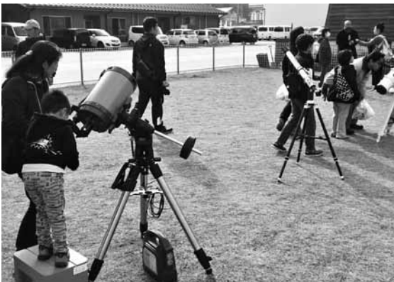
「遊四季多里」が主催する星の観望会の様子です。毎回、老若男女が美しい星空と宇宙の果てに思いを馳せています。

これらの団体の活動は、地域内外の交流を生む重要な取り組みであり、多里地域にとって大きな力となっています。今後もこのような活動の協力と後押しができるよう、まち協としても積極的な支援を行っていきます。