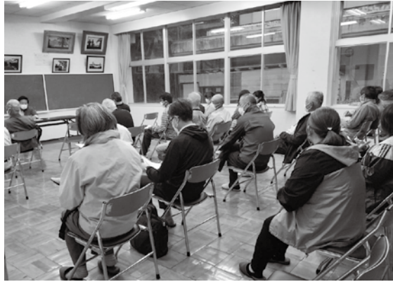
地域の安心・安全を守るため、互いに助け合い、支え合える地域づくりを目指し、様々な検討を重ねています。