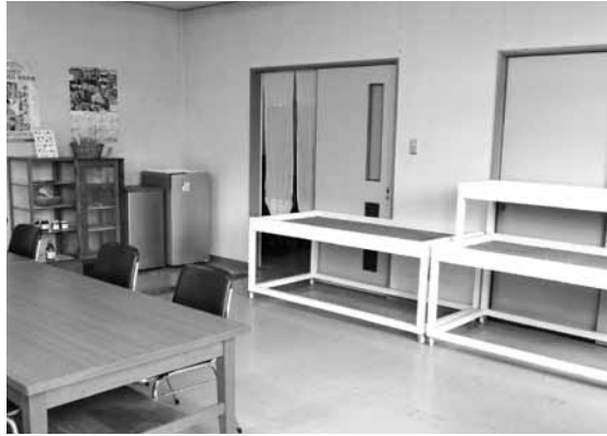
JA阿毘縁支所のあった場所を整備し、特産品販売のための台とテーブル・イスなどを設置しました。センター事務所もこちらへ移転し、管理を行います。