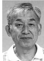
豊 柴 大 熊 勝