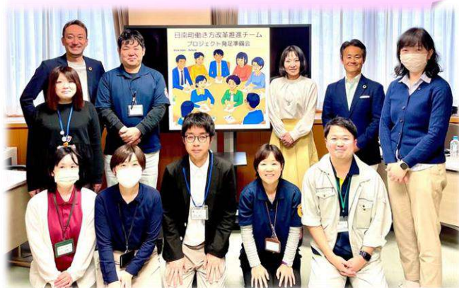
庁内働き方改革推進チーム