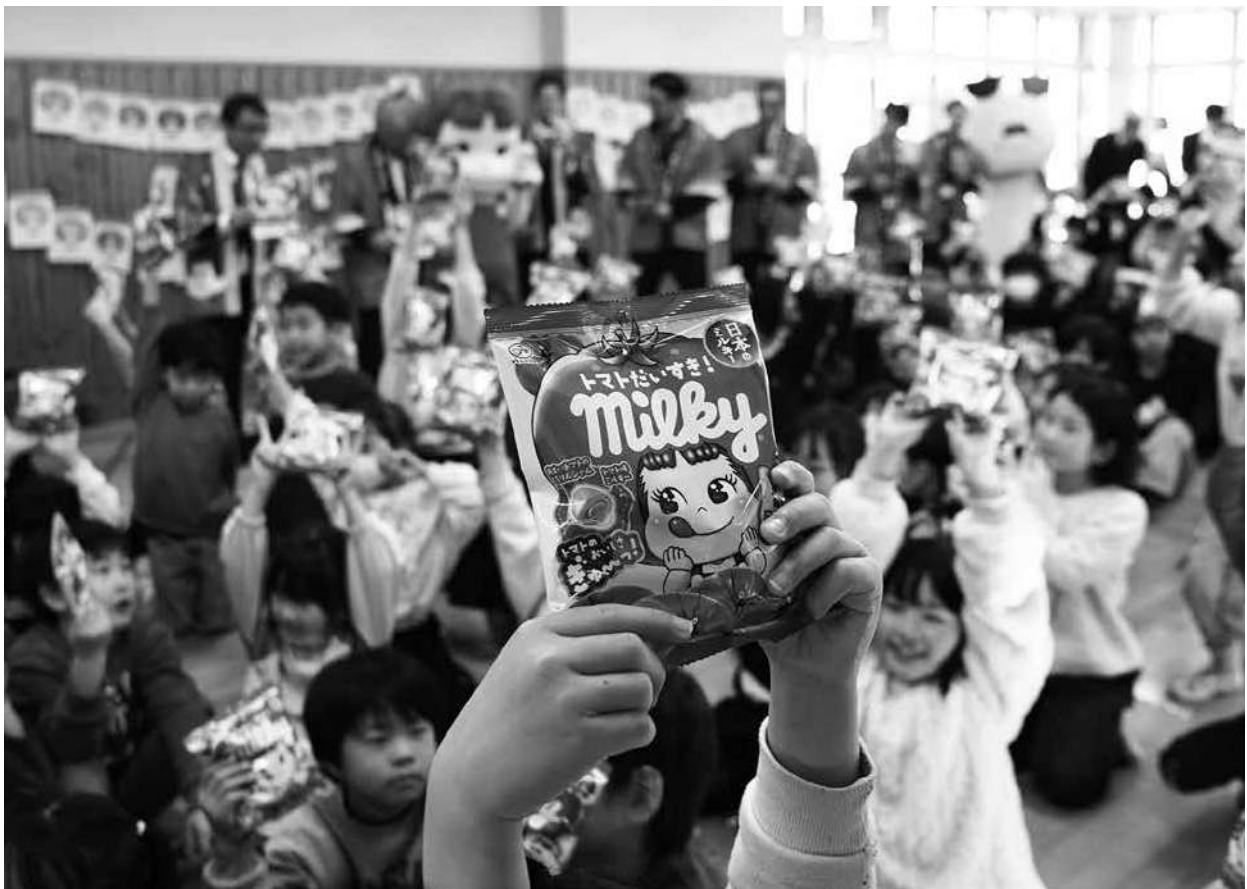
日南トマト®を使用した「トマトだいすき! ミルキー」全国販売開始