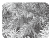
町の木 イチイ (S54. 11. 10 制定)