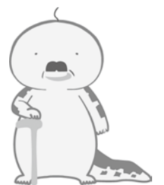
オッサンショウオ 日南町 公式キャラクター

※オンライン申請では戸籍情報がシステム連携され、戸籍謄本の提出が不要となります。（令和8年7月以降、パスポート取得手数料などが改定される可能性があります。）