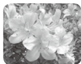
町の花 サツキ (S54. 11. 10 制定)

「日」「ナ」「ン」の文字を組み合わせ飛翔する鳥をかたどることで、町勢の力強い飛躍発展を、また、円により町民の円満融和を表現。