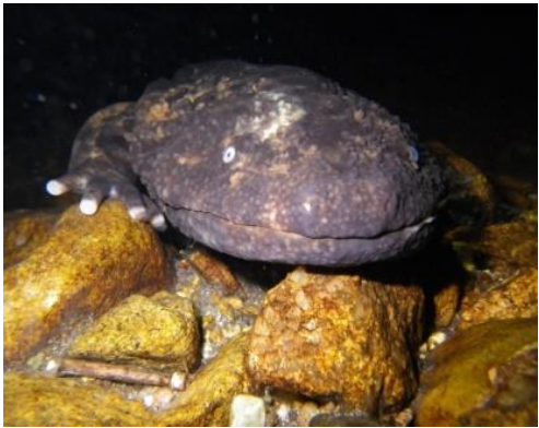
国の特別天然記念物「オオサンショウウオ」

日南町は鳥取県西部を流れる一級河川「日野川」の源流があり、下流域住民の水瓶として適切な森林管理により、水源涵養を育む責務があります。森林に由来する、生態系の保全も目標の一つです。