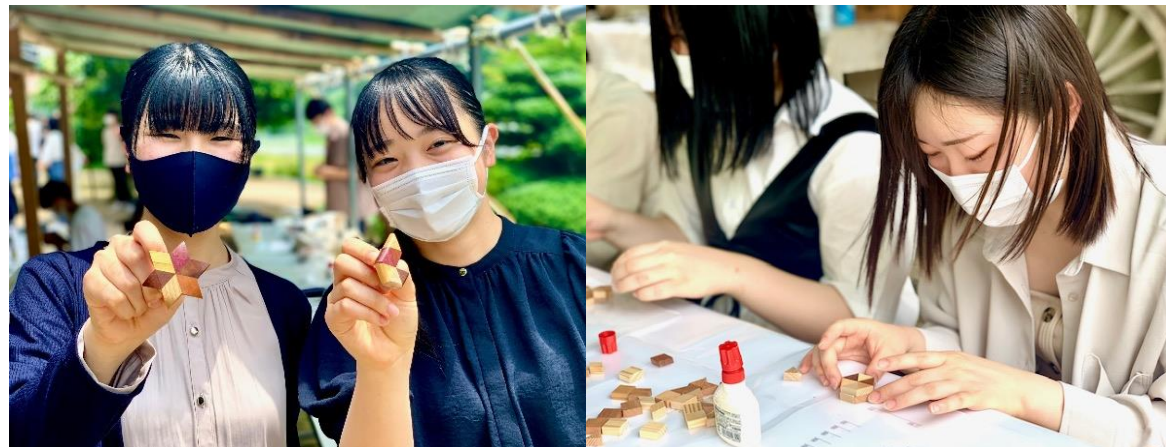
日本海新聞 令和6年5月22日(水)

2021年にはコロナ禍により、これまで県外や海外に修学旅行を行っていた中高生が、行動制限等もあり県内への行程となった。こうした中で、これまで修学旅行等の受け入れの実績がほとんどなかった日南町が“SDGs教育”のフィールドへ名乗りを上げ、修学旅行や教育旅行の受け入れ先として注目された。