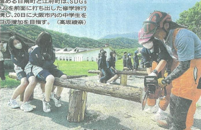
チェーンソー体験をする生徒ら=20日、江府町御機のエバーランド奥大山

森林や水などの自然資源を生かしたまちづくりを進める日南町と江府町は、SDGs(持続可能な開発目標)をテーマにした体験型プログラムを前面に打ち出した修学旅行の誘致に本腰を入れ始めた。本年度は両町が初めて連携し、20日に大阪市内の中学生を受け入れた。両町は今後、プランの充実を図り、交流人口の増加を目指す。(高坂綾奈)