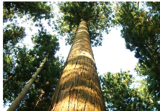
適切な森林管理による災害防止、水源涵養機能の保全