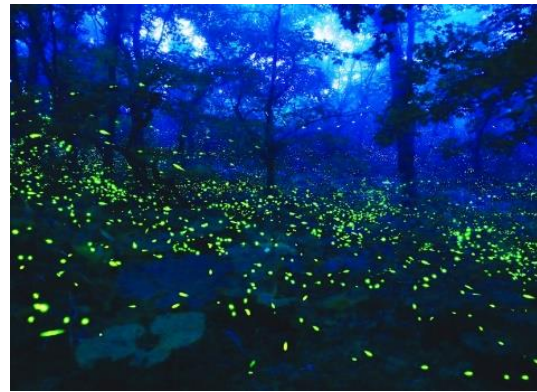
ヒメホタルとゲンジホタルが共に生息する貴重な環境