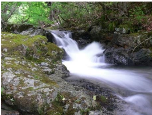
一級河川「日野川」の源流域