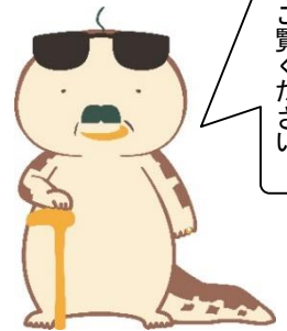
日南町公式キャラクター「オッサンショウウオ」