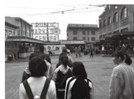
Nichinan JHS Students in Seattle シアトルで研修中の日南中学生 （パイクプレイスマーケット・シアトル市）