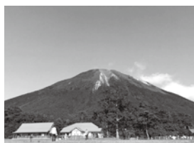
Mt. Daisen in Summer 夏の大山