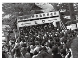
My First Hatsumode 日本で初めての初詣（白山神社・新潟市）

Happy New Year, everybody! Around the end of the year, I like to spend time to reflect on how the year has gone. Some people keep a diary to document their year, but I prefer to keep track of my experiences through taking pictures. I love visiting new places to take interesting photos. In this way, I can combine my hobbies of photography and traveling. Here are my top five favorite moments from 2018 as expressed in photos. I hope that 2019 will be as full of adventures as 2018 was.