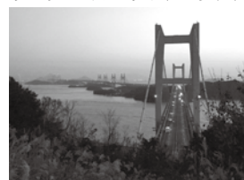
The Great Seto Bridge in Autumn as Seen from Kurashiki 倉敷から見た秋の瀬戸大橋