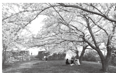
Cherry Blossoms at the Ruins of Yonago Castle 米子城跡の桜