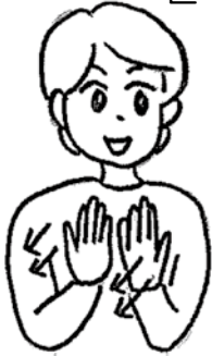
手のひらを上に向けた両手を並べ軽く2回下げる。(本を開いて学ぶ様子を表す)