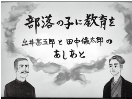
紙芝居がDVDになっています

このお話のDVDを鑑賞して、誰もがおかしいと思ったことは声に出せる世の中になっていかなんといけない。一人ひとりの人権の大切さと私たちのあり方について考える学習ができました。