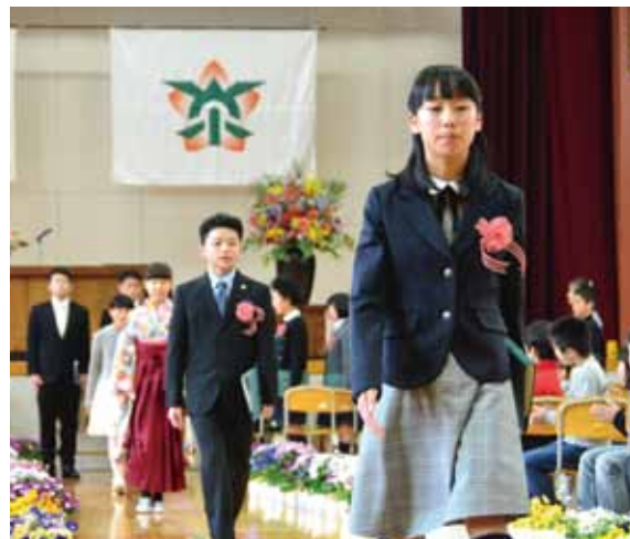
3/15 日南小学校卒業式