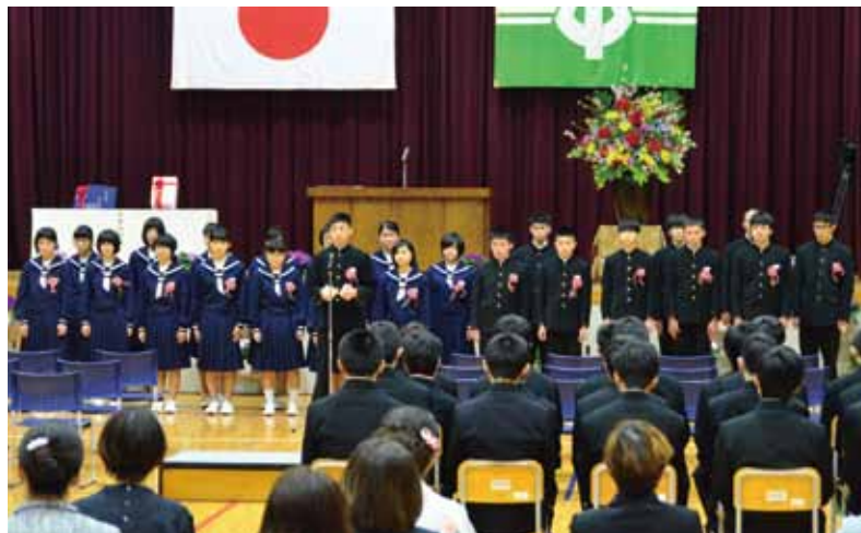
3/11 日南中学校卒業式

日南小学校6年生27名、日南中学校3年生25名が卒業式を迎え、新たな一歩を踏み出しました。中学3年生には、9年間過ごした仲間との別れと、新しい仲間との出会いへスタートとなりました。