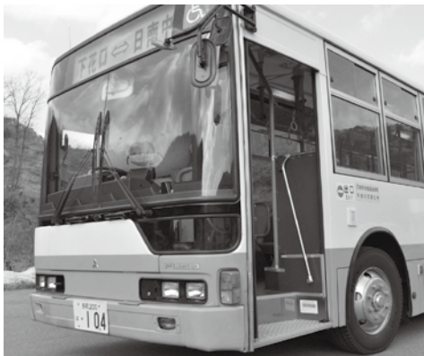
▲通院、買い物、通学など、地域の生活を支える町営バス。今後も利用しやすく、持続可能な運行形態を目指していきます。

町営による運行開始からこれまでにデマンドバス、巡回バスの導入など、様々な取り組みを行ってきました。近年では、平成27年度に実施した公共交通の調査結果を基に、平成29年4月に運行形態の大幅な改正を行い、運行ダイヤの見直し、車両の