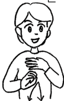
左の4本の指を伸ばし右の親指と人さし指をつけて離す。(右手は月の形を表す)