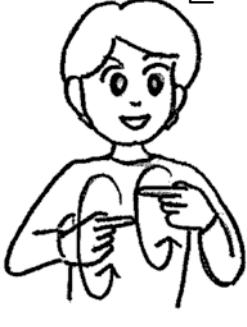
両手の人さし指を横に伸ばして向かい合わせ交互に前に回す。