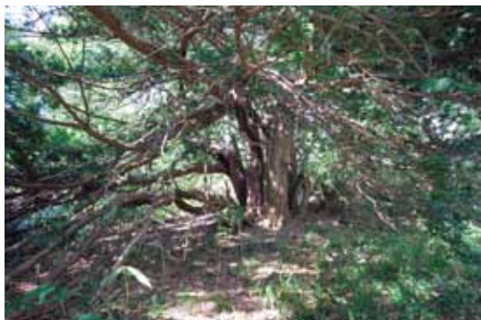
イチイ (イチイ科) 鳥取県その他重要種

高さ20mになる常緑針葉樹。船通山のイチイは積雪と強風のため横に伸び、枝張りは20m以上に広がる。