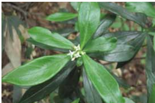
カラスシキミ (ジンチョウゲ科) 鳥取県絶滅危惧Ⅱ類

県内では限られた場所にしか生育しない。やや高地の山林中に生育する常緑低木。雄の木と雌の木がある。日当たりのよい落葉樹林内の尾根に生える。よく似たミカン科のツルシキミとは同所的に生えない傾向がある。花期は6月で、枝先に集まって10個ほどの白色の花をつける。果実は7-8月に赤く熟して目立つ。保護するためには明るい広葉樹林を維持することが重要。