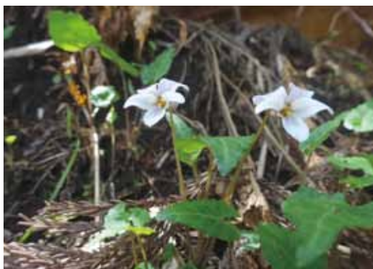
ヒナスミレ (スミレ科)

主に太平洋側に多く生育しているスミレで、西日本での生育地は少ない。落葉広葉樹林内や林縁に生育する。