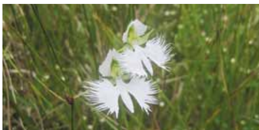
サギソウ (ラン科) 鳥取県絶滅危惧Ⅰ類

山地の日当たりの良い湿地に生育する多年生草本。花がシラサギが翼を広げたような形をしていることから名前が付けられた。