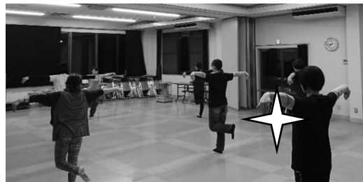
実際のレッスンの様子です。↑