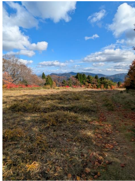
↑11/11(火)花見山中腹にて

★別日11/11(火)旧花見山スキー場(ホワイトロングコース途中付近)有志にて「マツムシノウ」保護のため草刈りを行いました。