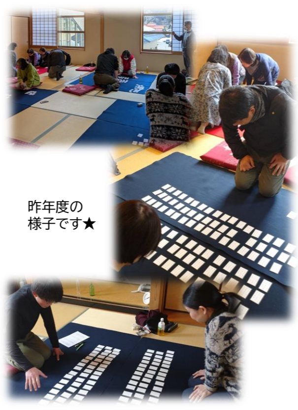
昨年度の 様子です★

やってみなければわからない！ 競技かるたの魅力体験！ もちろん見学だけでも大歓迎★