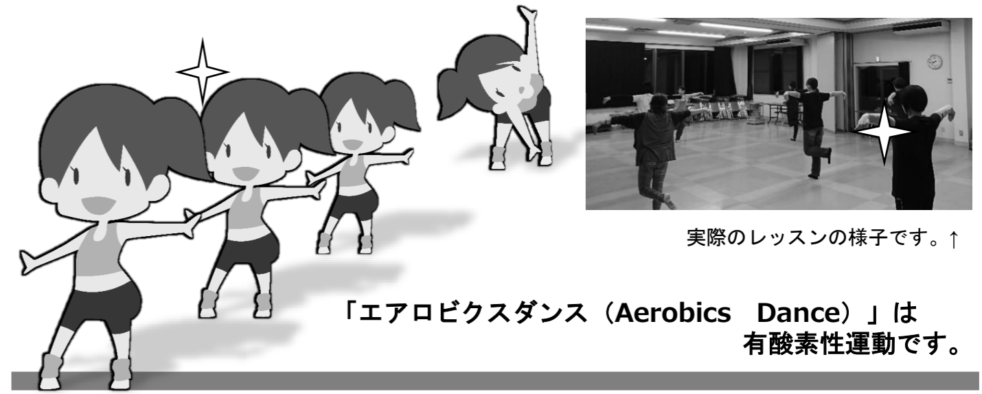
実際のレッスンの様子です。↑