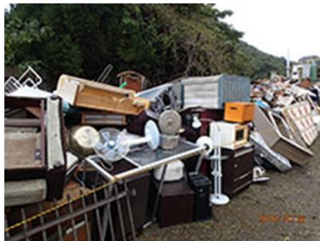
平成28年鳥取県中部地震 鳥取県