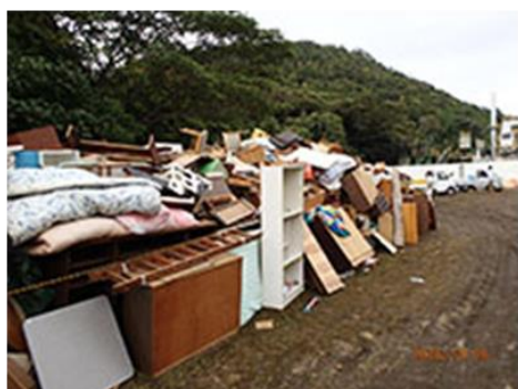
平成28年鳥取県中部地震 鳥取県