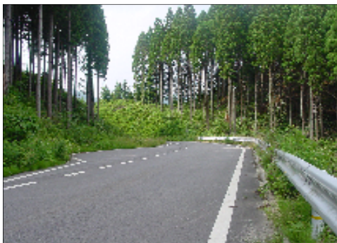
森林基幹道窓山線(整備済み)