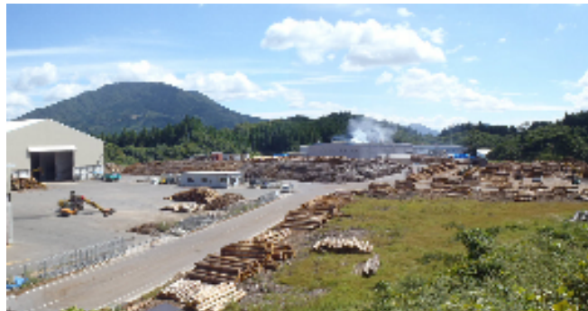
町内にある新木材団地